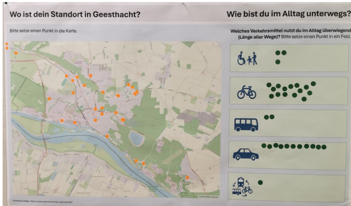
Abfragen: Wo ist dein Standort in Geesthacht

Anhand von zwei Abfragen werden beim Einlass Eindrücke über Hintergründe der Teilnehmenden hinsichtlich ihrer Standorte (Wohnen/Arbeiten) in Geesthacht sowie ihrer Verkehrsmittelwahl gewonnen.